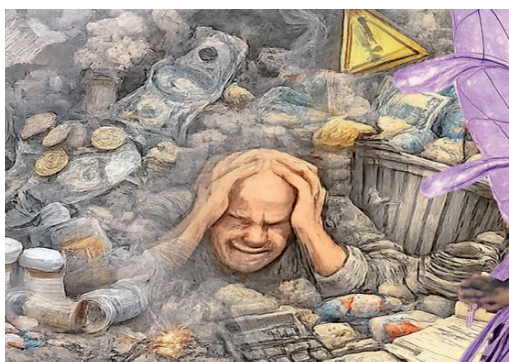
Detalhe de obra do artista Valdecir Gerotto