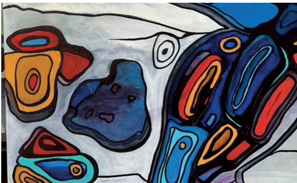
Detalhe da obra do artista plástico Araguaí Garcia, acrílica sobre tela, uma das que estarão expostas

Na abertura da exposição, o shopping irá oferecer um coquetel aos presentes. O evento será itinerante, migrando do shopping para o Teatro Municipal e terminando sua “turnê” na Sociedade de Medicina e Cirurgia, na semana do Jantar Baile de 100 anos, em junho.