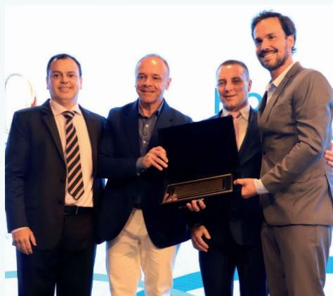
Prêmio Voluntário APM Rio Preto CAMF

E não seria diferente senão o próprio Dr. Eleuses receber este prêmio por sua trajetória. Atual secretário de Estado da Saúde de São Paulo, ele também foi presidente da Sociedade de Medicina e Cirurgia de Rio Preto, da Associação Paulista de Medicina e da Associação Médica Brasileira, além de deputado federal em várias legislaturas.