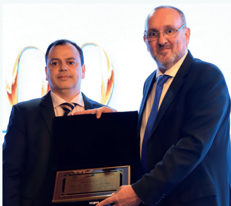
Prêmio Mérito Científico Prof. Dr. Mauricio Lacerda